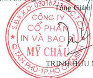
TRINH HỮU MINH